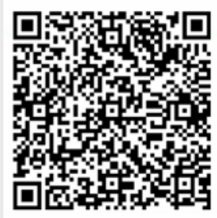
Hurricane Harbor Oaxtepec

Aplicable para: alumnos, alumnas, egresados, egresadas, colaboradores y colaboradoras.