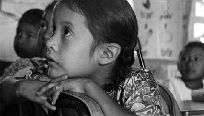
Foto archivo Proyecto 50-50, doble inmersión, del Sector XVI de Educación Indígena, Guerrero.

específico (Cap.3, pp.28-36), la Compañía de Jesús declara que ésta juega un papel fundamental en la transformación de la sociedad, ampliando el conocimiento útil y riguroso en búsqueda de niveles más profundos de justicia y libertad.